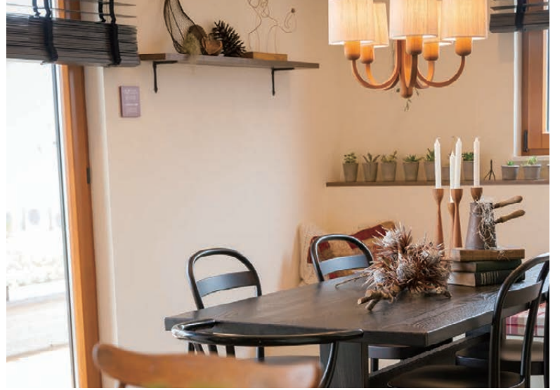
キッチン 食を通じて家族をつなぐ大切な場所です。くつろぎを促すインテリアを心掛けて。