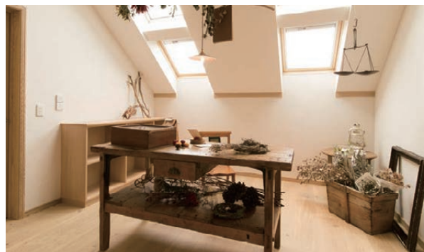
オールルーム 書斎や物干スペースなど、 アイデア次第でさまざまな部屋に転用できる空間です。