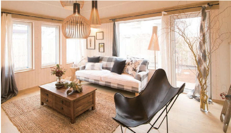
リビング 開放感ある吹き抜けは、思わず床に寝転がって見上げたくくなります。

また、開放的な吹き抜けのリビング、外へとつながる軒下空間も特徴の一つ。縦と横に広がる空間はくつろぎの時間を創り出します。